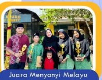
Juara Menyanyi Melayu tingkat SMP dan SMA