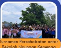
Turnamen Persahabatan antar Sekolah Naungan Kemenag