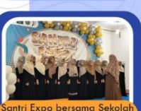
Santri Expo bersama Sekolah Naungan Kemenag