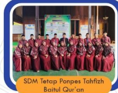
SDM Tetap Ponpes Tahfiz Baitul Qur'an