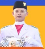
PASKIBRA KABUPATEN Tingkat Kabupaten Lingga Tahun 2024