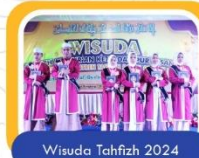
Wisuda Tahfiz 2024