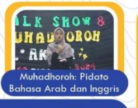
Muhadhoroh: Pidato Bahasa Arab dan Inggris