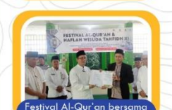
Festival Al-Qur'an bersama LPQ Jakarta