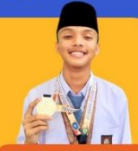
GOLD DAN BRONZE POPDA Cabang Atletik tingkat Provinsi tahun 2024