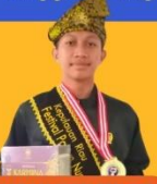
DELEGASI KEPRI FPN 2024 Festival Pantun Nusantara tingkat Nasional 2024

Para santri berhasil meraih berbagai prestasi dari tingkat kabupaten hingga ke tingkat internasional, beberapa diantaranya adalah: