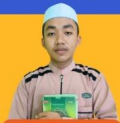
FADILLAH FATMA Program SMAS BQ 2022

Selama 12 tahun berdiri, Alhamdulillah Pondok Pesantren Tahfiz Baitul Qur'an telah melahirkan lebih dari 50 santri hafiz dan hafizah 30 Juz.