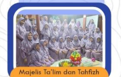
Majelis Ta'lim dan Tahfiz Al-Qur'an BQ