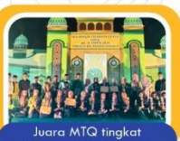
Juara MTQ tingkat Kecamatan - Provinsi