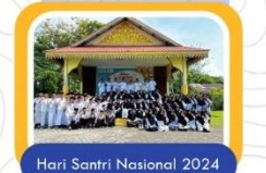
Hari Santri Nasional 2024