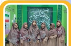
SDM TPQ Baitul Qur'an