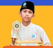
JUARA 2 SYAIR GURINDAM Tingkat Kabupaten SMP Sederajat 2024