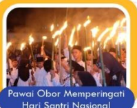
Pawai Obor Memperingati Hari Santri Nasional