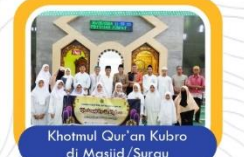
Khotmul Qur'an Kubro di Masjid/Surau