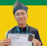
BRONZE MEDAL IABO 2024 International Applied Biology Olympiad

Para santri berhasil meraih berbagai prestasi dari tingkat kabupaten hingga ke tingkat internasional, beberapa diantaranya adalah: