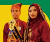
JUARA 1 DUTA MUSEUM Tingkat Kabupaten SMA Sederajat