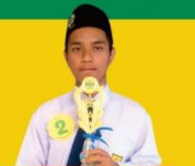
JUARA 3 ALIH AKSARA Tingkat Kabupaten SMP Sederajat