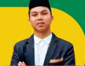
BIMA PRAKASA Informatika - U. Andalas