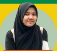
DAH RAMADHANI Program SMAS BQ 2020