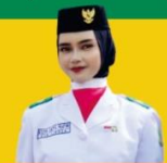
PASKIBRA KABUPATEN Tingkat Kabupaten Lingga Tahun 2023