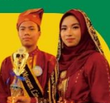
JUARA 1 DUTA MUSEUM Tingkat Kabupaten SMA Sederajat