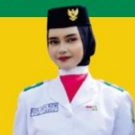
PASKIBRA KABUPATEN Tingkat Kabupaten Lingga Tahun 2023