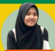
DAH RAMADHANI Program SMAS BQ 2020