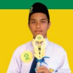
JUARA 3 ALIH AKSARA Tingkat Kabupaten SMP Sederajat