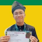
BRONZE MEDAL IABO 2024 International Applied Biology Olympiad

Para santri berhasil meraih berbagai prestasi dari tingkat kabupaten hingga ke tingkat internasional, beberapa diantaranya adalah: