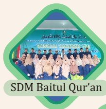
SDM Baitul Qur'an