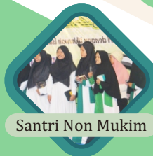
Santri Non Mukim